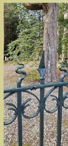
Stille getuigen van de beschietingen

En met het luiden van de enige klok die in 1945 nog in Assen luiden kon, werd er getoost op de vrijheid wat deze oorlogswandeling tot een evenement maakte om niet te vergeten.