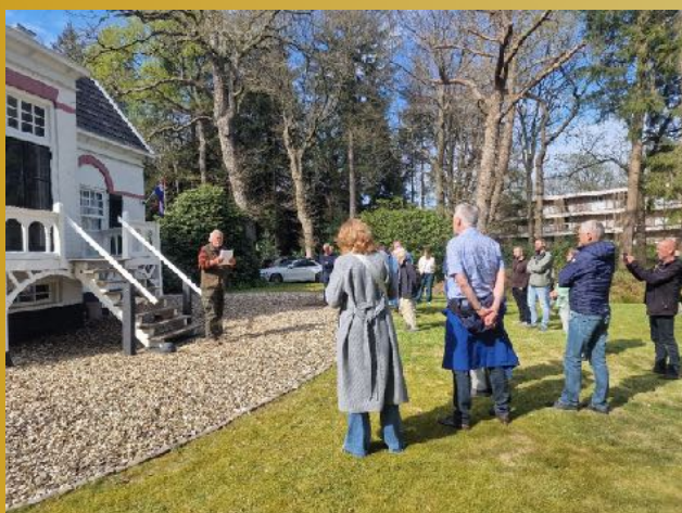
Toost op de 80 jarige bevrijding van Assen

Het sloot af bij het boswachtershuis op landgoed De Eerste Steen met het compleet nieuwe bevrijdingsverhaal van de zussen Strijker, die daar woonden.