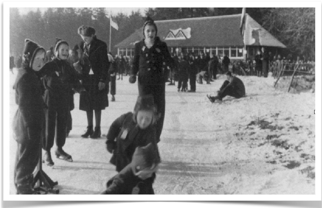
Schaatspret in het verleden op de ijsbaan in het Asserbos

Ook hebben we een Facebooksite: Vereniging Vrienden van het Asserbos en omgeving.