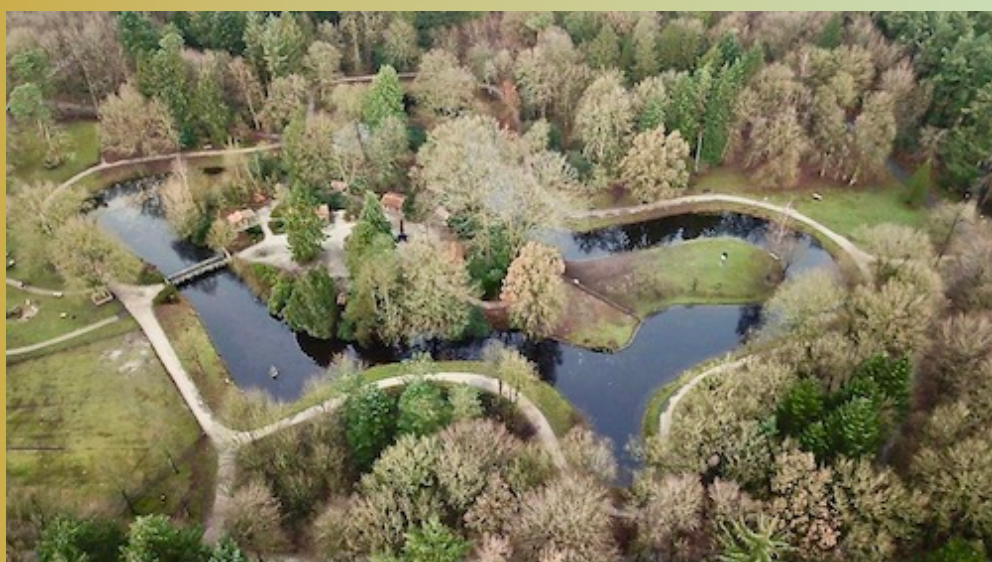
de Nieuwe Vijver